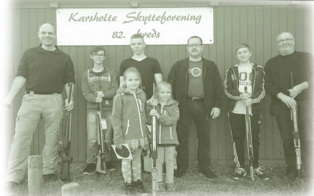
Nogle af foreningens medlemmer foran det nye klubhus på Bakkevej i 2014.

Karsholte Skytteforening var den første forening, der blev oprettet i Tersløse Sogn.