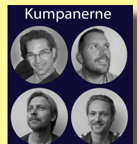
Kreddy & Kumpanerne