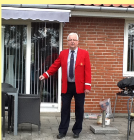
Den syngende post